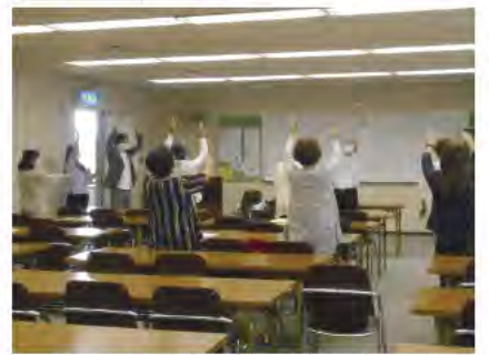
兵庫県シルバー人材センター協会主催 家事支援講習会